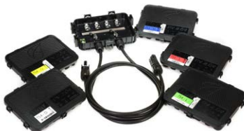
TS4-B (Piattaforma integrata nel modulo)

Un'unica Junction Box con 5 cover intercambiabili, per la massima libertà di scelta.