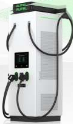
Unità di ricarica all-in-one 120kW-480kW