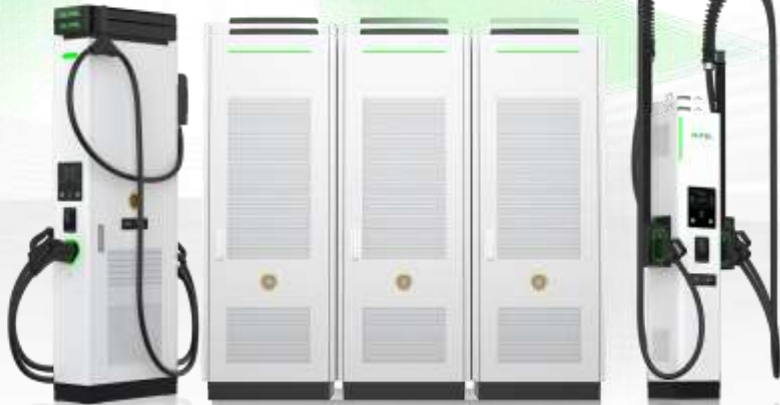
Unità di ricarica di distribuzione 120kW-1440kW

La serie MaxiCharger DC di nuova generazione offre la rete di ricarica intelligente one-stop, con innovazioni all'avanguardia basate sull'IA. Offre prestazioni affidabili grazie al design completamente modulare, alla tecnologia Eco-Cooling e al backup a caldo della rete a livello del sito. La compatibilità intelligente veicolo-caricatore-sito e la tecnologia di previsione della curva di ricarica consentono ai clienti di massimizzare il rendimento. Abbinato all'integrazione FV+ ESS e agli algoritmi di dispacciamento dell'energia, ottimizza il costo totale di proprietà (TCO) e aumenta i ricavi.